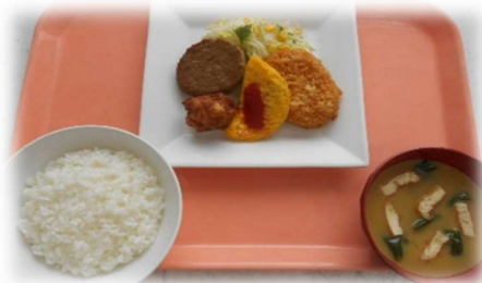
埼玉栄ランチ (ハンバーグ・コロツケ・オムレツ、唐揚げ) 410円