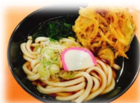
かき揚げうどん・そば 380円