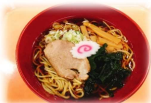
しょうゆラーメン 370円