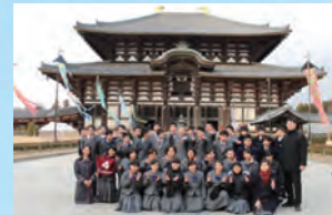
京都・奈良校外学習

[21世紀に活躍できる人材の育成]は、本校の目標のひとつです。そこで、私学ならではの多彩なプログラムを用意。真の国際人を育成するために、日本人のアイデンティティをベースに持ち、グローバルな視野で国際理解を深められる人間教育を実践しています。