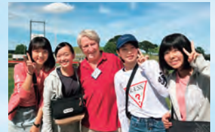
オーストラリア修学旅行